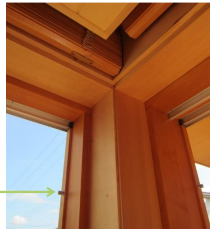
引戸用ロックボルト金物 枠側に上下2ヶ所あります。 これを可動障子のギアに引っかけて固定します。 施錠と強固なエアタイトを生み出します。