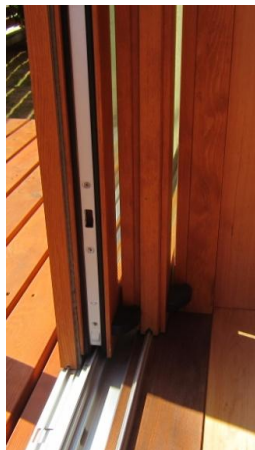
障子断面のヘーベシーベギア