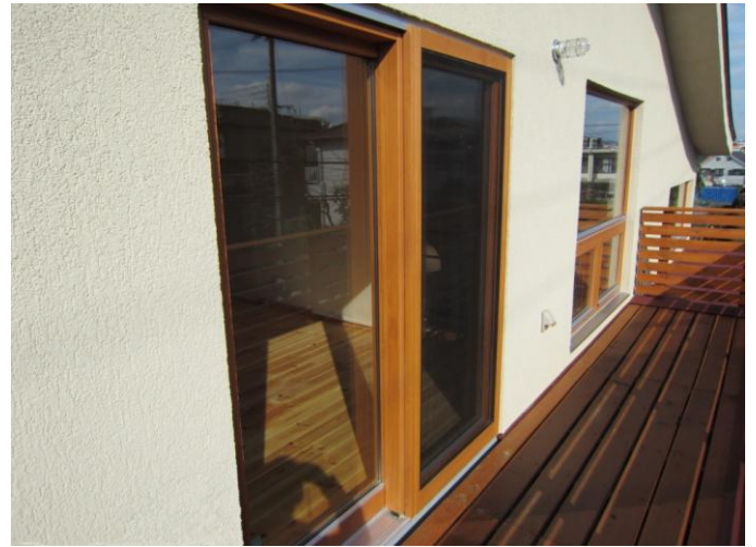
ヘーベシーベ外観 ※木製網戸です。