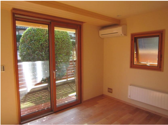
片引き戸(ヘーベシーベ構造) リフトアップスライド・システムにより、 小さな子供でも無理なく操作ができます。 レバーハンドルによる回転操作で開閉します。